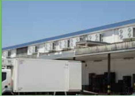
Distribución de fruta Cádiz, España