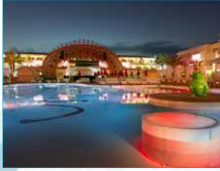
Hotel Ushuaia Ibiza, España