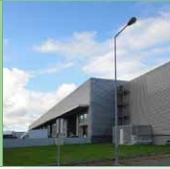
Distribución de pescado Azores, Portugal