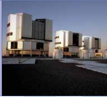
Paranal Observatory ESO Desierto de Atacama, Chile