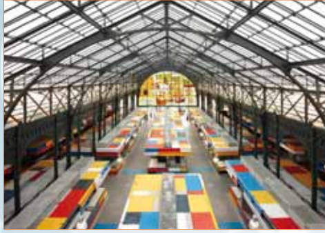
Mercados Atarazanas Málaga, España