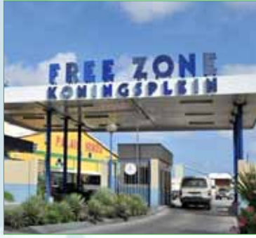
Corpmed Pharma Hato Free-zone, Curaçao