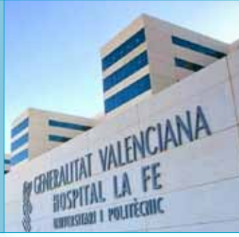
Hospital La Fe Valencia, España