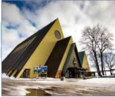
Fram Museum Oslo, Noruega