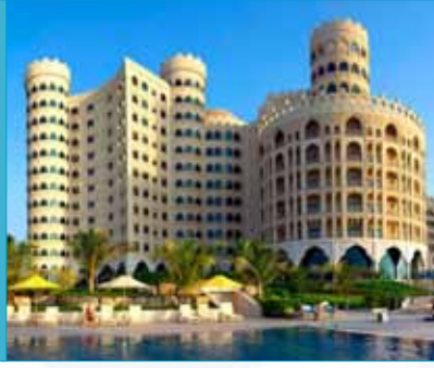
The Palace Ras Al Khaimah Emiratos Árabes Unidos