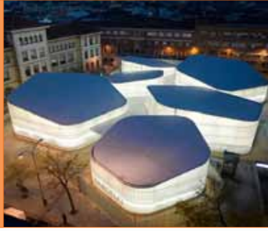
Mercado Barceló Madrid, España